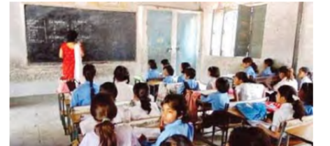
గతంలో డబ్బు పెట్టెనే మంచి విద్య" అనే భావన బలంగా ఉండేది. ఇప్పుడు ఆ భావన క్రమంగా కూలిపోతోంది. భారీ ఫీజులు చెల్లించడం కంటే, నాణ్యమైన బోధన, మంచి ఫలితాలు ముఖ్యమని తల్లిదండ్రులు గుర్తిస్తున్నారు. ఫలితంగా ప్రభుత్వ పాఠశాలల్లో అడ్మిషన్ కోసం పోటీ పెరుగుతోంది. ఇది కేవలం విద్యార్థుల విజయమే కాదు, ప్రభుత్వ విద్యాలలు విజయమూ. ఉచిత పుస్తకాలు, యూనిఫార్ములు, మధ్యాహ్న భోజనం వంటి పథకాలు విద్యార్థుల హాజరును పెంచడంలో కీలక పాత్ర

ఉండటం వల్ల వ్యక్తిగత శ్రద్ధ తగ్గిపోతుంది. కానీ ప్రభుత్వ పాఠశాలల్లో ప్రతి విద్యార్థి అభివృద్ధి ఒకలక్ష్యంగా మారింది. ఇంకా ఒక ముఖ్యమైన అంశం తల్లిదండ్రుల దృక్పథంలో వచ్చిన మార్పు.