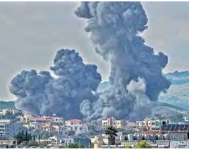
హెజ్జాల్లా కూడా ఇజ్రాయెల్ పైకి రాకెట్లు, ద్రోన్లతో దాడులు చేసింది. మరోవైపు, ఇజ్రాయెల్ జరిపినదాడుల్లో 12 మందికి పైగా మరణించినట్లు లెబనాన్ ఆరోగ్య శాఖ వర్గాలు తెలిపాయి. అయితే, మృతుల్లో ఎంతమంది పౌరులు, ఎంతమంది మిలిటెంట్లు ఉన్నారనే దానిపై స్పష్టత లేదు. దాడులకు ముందు పలు గ్రామాలలోని ప్రజలను సురక్షిత ప్రాంతాలకు వెళ్లాలని ఇజ్రాయెల్ సైన్యం హెచ్చరికలు జారీ చేసింది. ఇరుపక్షాల దాడులు, ప్రతిదాడులతో సరిహద్దు ప్రాంతాల్లో తీవ్ర ఉద్రిక్త వాతావరణం నెలకొంది.

జెరూజే, మే 3: ఇజ్రాయెల్, హెజ్జాల్లా మధ్య ఉద్రిక్తతలు మరోసారి తీవ్రస్థాయికి చేరాయి. లెబనాన్లోని హెజ్జాల్లా స్థావరాలపై ఇజ్రాయెల్ దీపాన్స్ ఫోర్సెస్ (ఐడిఎఫ్) భీకర దాడులు నిర్వహించింది. ఈరోజు తెల్లవారుజామున జరిపిన ఈ దాడుల్లో 50కి పైగా కీలక మౌలిక సదుపాయాల కేంద్రాలను ధ్వంసం చేసినట్లు ప్రకటించింది. దక్షిణ లెబనాన్, బెకా వ్యాలీలోని హెజ్జాల్లా స్థావరాలే లక్ష్యంగా ఈ ప్రమాణిక దాడులు జరిగినట్లు ఐడిఎఫ్ వెల్లడించింది. గత 24 గంటల్లోనే సుమారు 50 లక్షలపై దాడి చేశామని ఐడిఎఫ్ శనివారం ప్రకటించింది. ఈ వారాంతంలో మొత్తం 70 సైనిక నిర్మాణాలు, 50 మౌలిక సదుపాయాల స్థలాలతో కలిపి 120 లక్షలపై ధ్వంసం చేసినట్లు మరో సైనిక పేర్కొంది. హెజ్జాల్లాకు చెందిన కమాండో సెంటర్లు, ఆయుధాగారాలు, సైనిక భవనాలును ధ్వంసం చేసినట్లు ఐడిఎఫ్ తెలిపింది. తమ దేశ పౌరులు, సైనికులపై దాడులను అడ్డుకోవడానికి ఈ ఆపరేషన్ చేపట్టినట్లు స్పష్టం చేసింది. ఇరుపక్షాల దాడులు, ప్రతిదాడులతో అడివారం ఉదయం కూడా దాడులు కొనసాగాయని పేర్కొంది. ఇజ్రాయెల్ దాడులకు ప్రతిగా