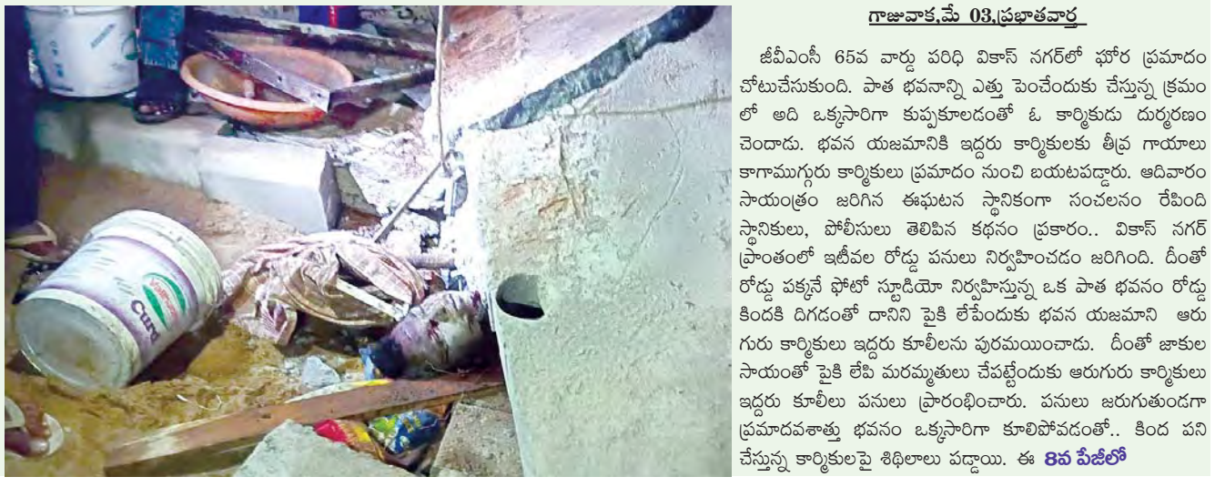
గాజువాక మే 03, ప్రభాతవార్త

జీవీఎస్ 65వ వార్డు పరిధి వికాస్ నగర్లో ఘోర ప్రమాదం చోటుచేసుకుంది. పాత భవనాన్ని అత్తు పెంచేందుకు చేస్తున్న క్రమంలో అది ఒక్కసారిగా కుప్పకూలడంతో ఓ కార్మికుడు దుర్మరణం చెందాడు. భవన యజమానికే ఇద్దరు కార్మికులకు తీవ్ర గాయాలు కావడం, కార్మికుల ప్రమాదం నుంచి బయటపడ్డారు. అదేవిధంగా సాయంత్రం జరిగిన ఈఘటన స్థానికంగా సంవలనం లేబిడి స్థానికులు, పోలీసులు తెలిసిన కడనం ప్రకారం.. వికాస్ నగర్ ప్రాంతంలో ఇటీవల రోడ్డు పనులు నిర్వహించడం జరిగింది. దీంతో రోడ్డు పక్కనే ఫోటో స్టూడియో నిర్వహిస్తున్న ఒక పాత భవనం రోడ్డు కిందకి దిగడంతో దానిని పైకి లేపేందుకు భవన యజమాని ఆరు గురు కార్మికులు ఇద్దరు కూలీలను పురమయించాడు. దీంతో జాతుల సాయంతో పైకి లేపే మరమ్మత్తులు చేపట్టేందుకు ఆరుగురు కార్మికులు ఇద్దరు కూలీలు పనులు ప్రారంభించారు. ప్రారంభించగా ప్రమాదవశాత్తు భవనం ఒక్కసారిగా కూలిపోవడంతో.. కింద పని చేస్తున్న కార్మికులపై శిథిలాలు పడ్డాయి. ఈ 8వ పేజీలో