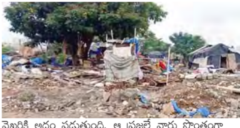
పట్టణంలోని దిల్లీ, వి

క్రమంలో ఆ ప్రజలు తమకు కోసిన సౌకర్యాలు కల్పించమని, ఇండ్లు మంజూరు చేయమని పలుమార్లు ప్రభుత్వాన్ని వెదుకున్నారు. గత ప్రభుత్వం కూడా ఒకసారి వీరిని వెళ్లగొట్టడాని చేసుకున్నప్పటికీ ఆ బాధితులు గట్టిగా నిలబడతూనే ఉన్నారు. అంతేకాని అక్కడి ఆ ఇండ్లలో నివసిస్తున్న ప్రజలకు అవసరమైన కనీసంవారి క సదుపాయాలైన మంచినీటిని, విద్యుత్తును అందించడానికి కూడా ప్రభుత్వం, ప్రభుత్వ అధికారులు ఎటువంటి చొరవ చూపకపోవడం పేద ప్రజల జీవితాల పట్ల పాలకులకు, అధికారులకు ఉండిపోతుంది నిర్లక్ష్యం.