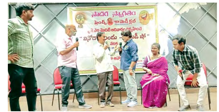
విశాఖపట్నం, మే 3, ప్రభాతవార్త

(ఫ్రెండ్స్ కామెడీ క్లబ్ విశాఖ, హైదరాబాద్ ప్రతి నెల నిర్వహించే వివేకాల విందల భాగంగా స్థానిక పౌరసంఘం ద్వారాకానగర్లో ప్రపంచ నవ్వుల దినోత్సవం పురస్కరించుకొని 8వ పేజీలో