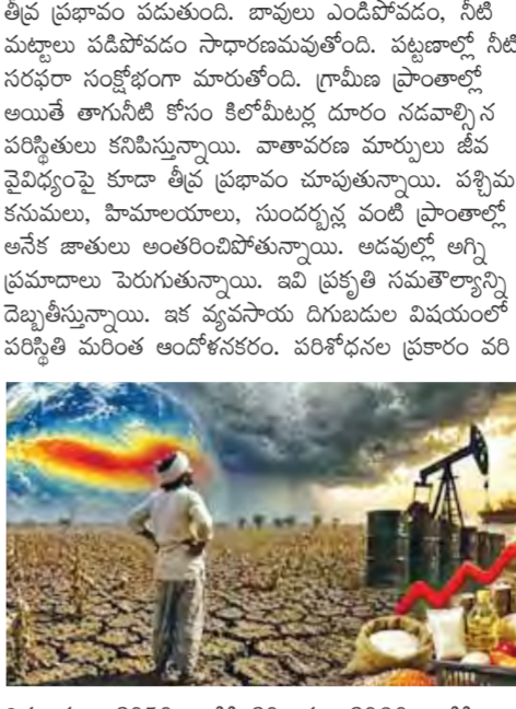
దిగుబడులు 2050 నాటికి 20 శాతం, 2080 నాటికి 47 శాతం వరకు తగ్గి అవకాశం ఉంది. గోధుమ దిగుబడులు కూడా 19 శాతం నుంచి 40 శాతంవరకు పడిపోవచ్చు.

తెలంగాణలో పాటు దేశవ్యాప్తంగా ఎండకాలం తీవ్రత రోజు రోజుకీ పెరుగుతోంది. గతంలో పోలి స్ట్రీ ఉష్ణోగ్రతలు గణనీయంగా పెరగడం, ఉత్పాదక అధికమవడం ప్రజలను తీవ్ర ఇబ్బందులకు గురిచేస్తోంది. ముఖ్యంగా ఈసారి పంటి వేడి మాత్రమే కాదు, రాత్రి వేడి కూడా పెరగడం పరిస్థితిని మరింత క్లిష్టం చేస్తోంది. సాధారణంగా అల్లడనాన్ని ఇస్తూ శరీరానికి విశ్రాంతినిచ్చే గ్రామీణులు కూడా ఇప్పుడు వేడి గాలులతో నిద్రపోతున్నారు. కనిష్ట ఉష్ణోగ్రతలు సాధారణం కంటే 4.5 నుంచి 6.4 డిగ్రీల సెల్సియస్ వరకు అధికంగా నమోదవడం వేడి రాతుల తీవ్రతను సూచిస్తోంది. వాతావరణ మార్పులు, పట్టణకరణ, గ్రీన్ హౌస్ వాయువుల పెరుగుదలకలిసి ఈ పరిస్థితిని తీవ్రమయ్యేలా చేస్తున్నాయి. ఎల్సినో ప్రభావం కారణంగా ఈ ఏడాది ఉష్ణోగ్రతలు మరింత పెరిగి అవకాశముందని నిపుణులు హెచ్చరిస్తున్నారు. పీడుగులు, నీటి ఎద్దడి, వ్యవసాయ నష్టాలు వంటి సమస్యలు పెరిగి ప్రమాదం ఉంది. 2023లో దేశవ్యాప్తంగా పీడుగుల వల్ల 2,560 మంది ప్రాణాలు కోల్పోవడం పరిస్థితి తీవ్రతను సైబ్బంగా తెలియజేస్తోంది. ఆంధ్రప్రదేశ్ లో 99 మంది, తెలంగాణలో 47 మంది మరణించడం అప్రమత్తం ఎంత అవసరమో చెబుతోంది. ఎల్సినో ప్రభావంతో ఋతుపవనాలు అలస్యమవుతాయి. దీనివల్ల ఎండలు సాధారణం కంటే ఎక్కువకాలం కొనసాగుతాయి. వర్షపాతం తగ్గిపోవడం లేదా అలస్యపడడం వల్ల రైతులు విత్తనాలు వేయడంలో ఇబ్బందులు పడతారు. విత్తనాలు అలస్యమైతే పంటలు పెరుగుదల ప్రభావితం అవుతుంది. దిగుబడులు తగ్గిపోవడం వల్ల రైతుల ఆదాయం పడిపోతుంది. ఇది వ్యవసాయ రంగానికి మాత్రమే కాదు, దేశ ఆర్థిక వ్యవస్థను కూడా దెబ్బతీస్తుంది. నీటి అయోగ్ నివేదిక ప్రకారం దేశంలో సుమారు 60 కోట్ల మంది నీటి ఎద్దడిని ఎదుర్కొంటున్నారు. ఒక్క డిగ్రీ ఉష్ణోగ్రత పెరిగినా భూగర్భ జలాలపై